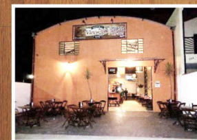
Rua Tancredo Neves, 774 Centro Tremembé