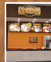
Praça de Alimentação Shopping Pátio Pinda